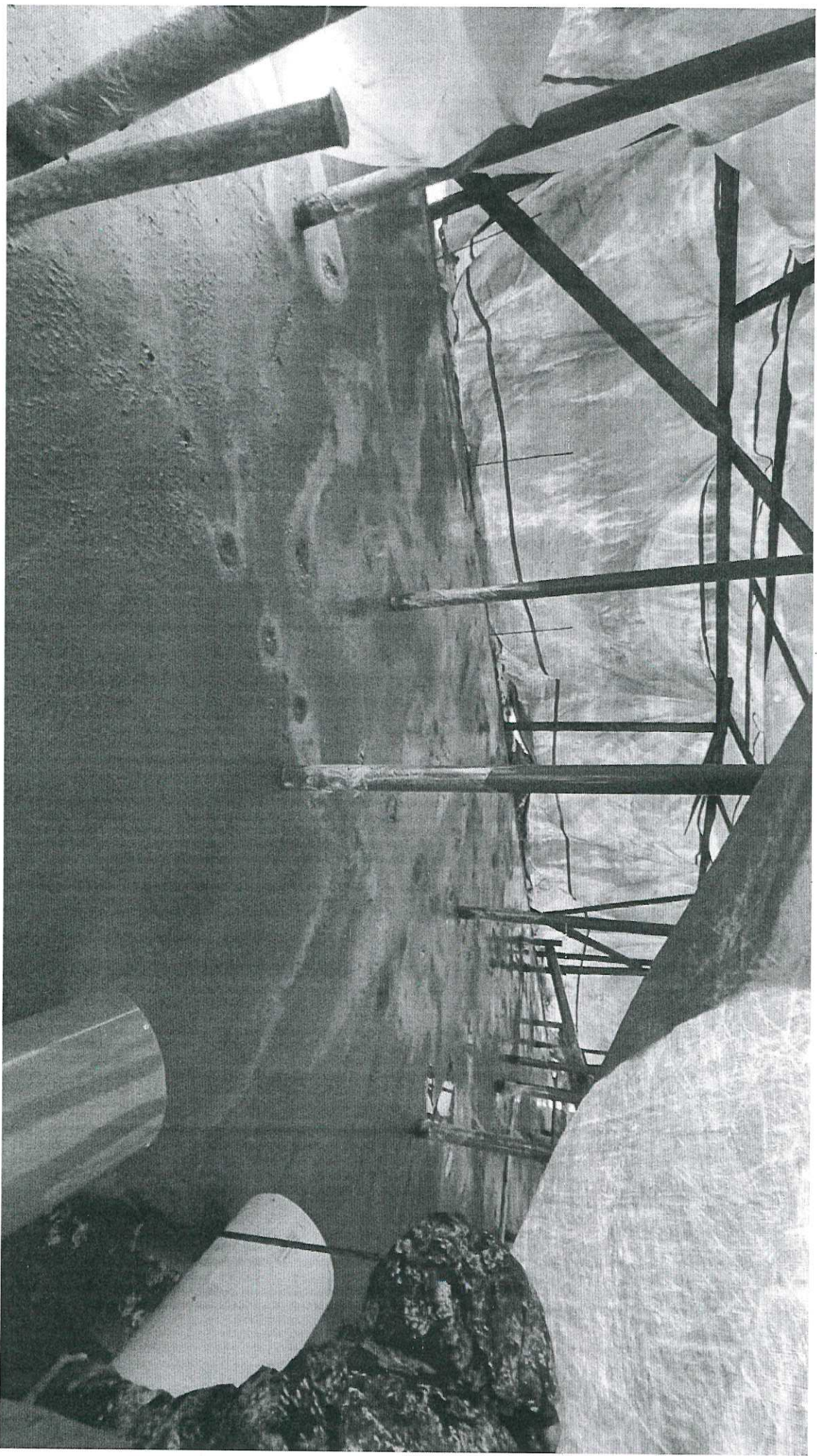
Фотографии объекта по итогам реализации проекта