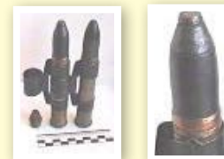
б) авиационные снаряды