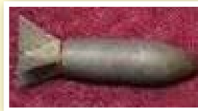
а) артиллерийский снаряд