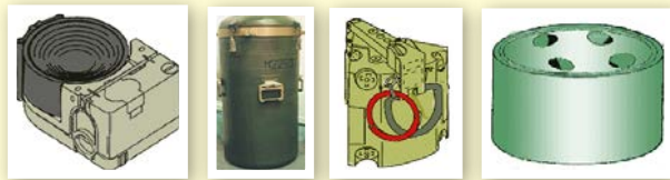
е) противопехотные мины