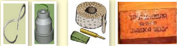
а)кумулятивный заряд б) эластит в) тротильная шашка