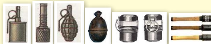
в) ручные гранаты