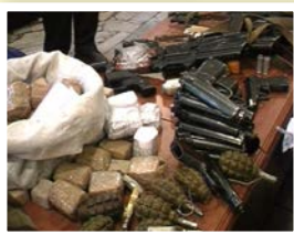
Рис. 5 Элементы «экипировки» террористов, захвативших Культурный центр на Дубровке в 2002 г.

Не только специалистам, но и обычным гражданам в интересах собственной безопасности следует знать рекомендуемые средние расчётные дистанции безопасного удаления, которые необходимо соблюдать при обнаружении взрывного устройства или предмета, похожего на взрывное устройство: