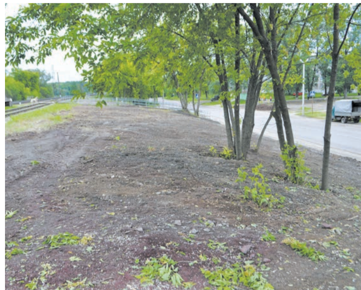
После проведения работ