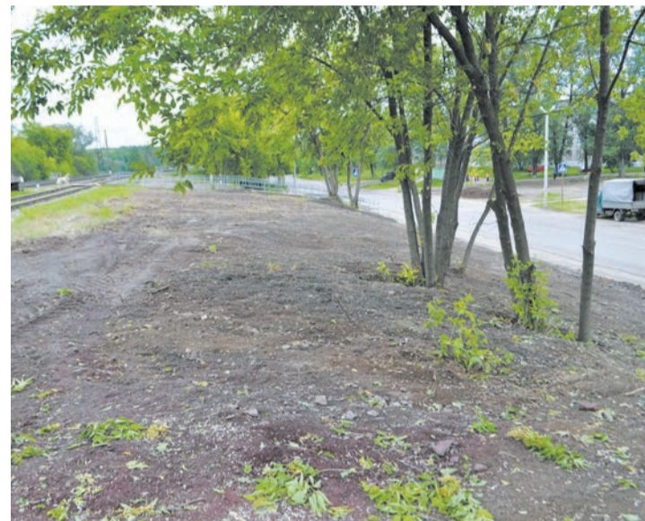
После проведения работ