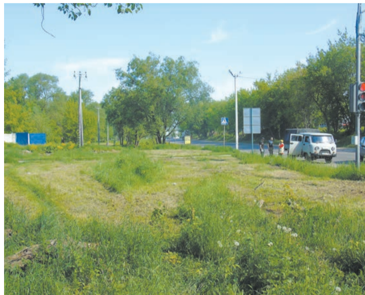
До начала субботника

подготовительные работы: выпиливали аварийные деревья, выкорчевывали пни, убирали кустарник, вывозили мусор, правили рельеф, насыпали плодородный грунт. Сегодня мы вышли на финишную прямую – посадили газонную траву. С утра идет дождь, поэтому наши семена обязательно должны прорасти. Несмотря на то, что мы все промокли и устали, у нас есть удовлетворение от проделанной работы. Результат уже сейчас виден: ровный красивый склон, который в скором времени будет зеленым, радует глаз. Нашу акцию мы будем продолжать. В наших силах сделать город лучше. Поэтому мы никого не ждем, а берем инициативу в свои руки и делаем».