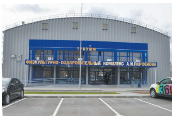
17 февраля сдан в эксплуатацию физкультурно-оздоровительный комплекс «Триумф» им. А.М. Парфенова по ул. Ломоносова.