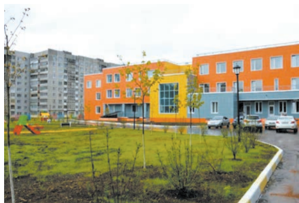
5 мая официально открыт новый комплекс детского сада № 61 «Мечта» по ул. Рабочей.

Уважаемые жители Воскресенского района! Поздравляем вас с Днем России, Днем района, Днем города!